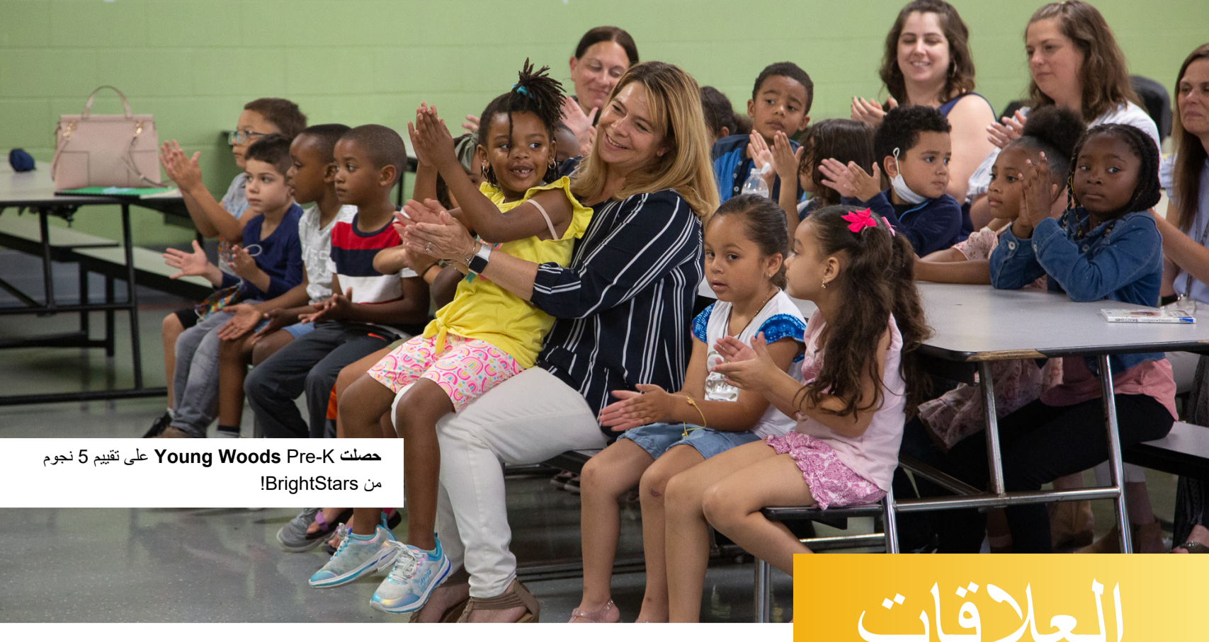
حصلت Young Woods Pre-K على تقييم 5 نجوم من BrightStars!